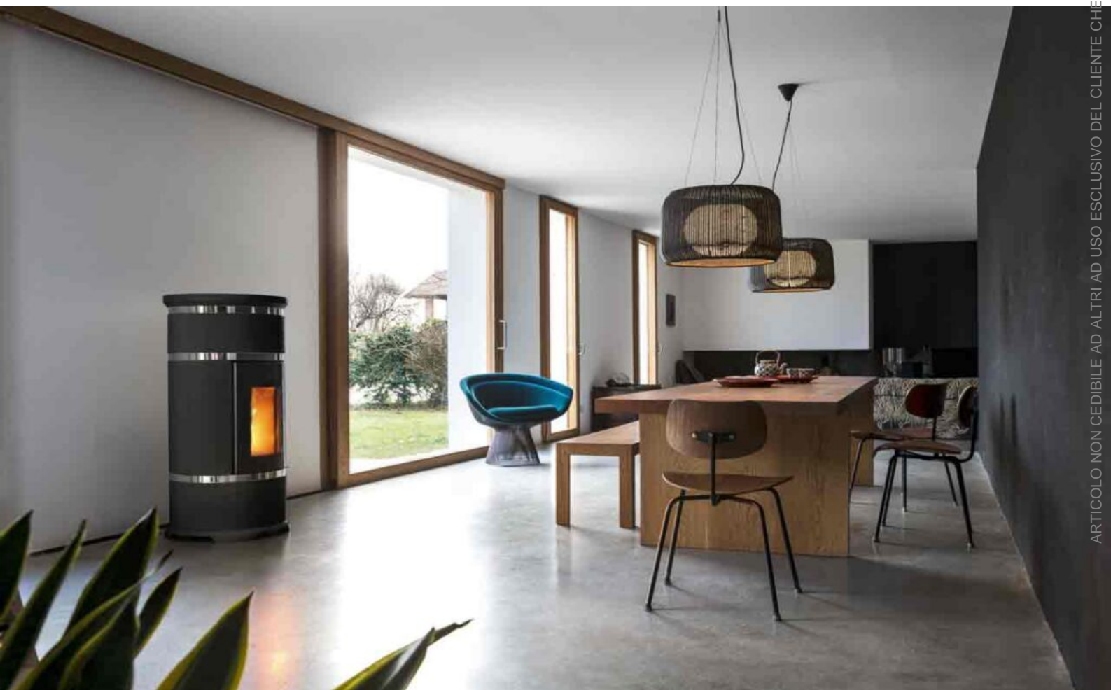
Stufa a pellet Maria Sofia di Sergio Leoni