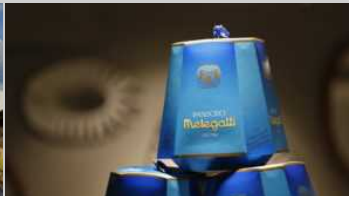
Melegatti riparte, pandori a ruba nei negozi