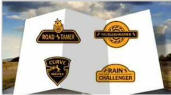
A Verona Continental presenta i Gripster