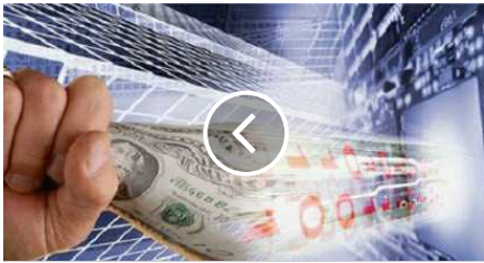
Contanti o denaro elettronico? Favorevoli e contrari.